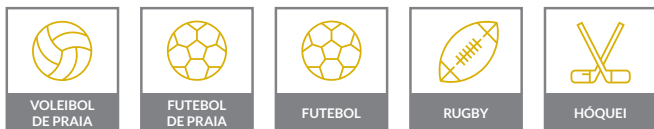
2045 SCORE 2D

Distância de leitura 200 metros – dígitos 45 cm