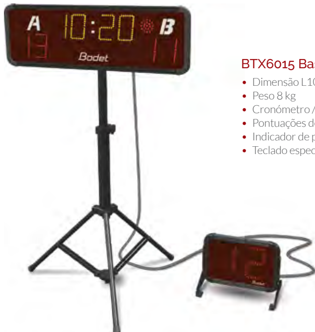
BTX6015 Basket 3x3